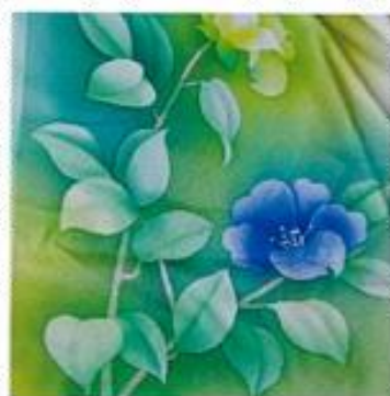
優しい花柄の着物が