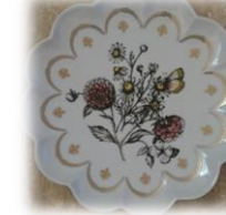
その時々に合わせて♪飾ったり食器としてもステキ♪