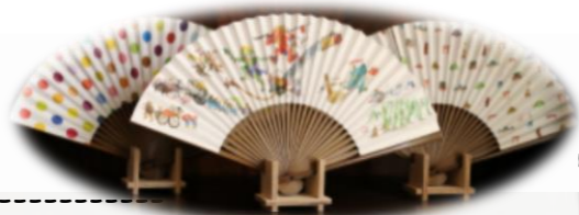
「これからよくなる」という意味の吉兆柄をのせた扇子

きものを収納する「多通紙(たとう紙)」やお懐紙、のし紙、御見おさえ紙・工芸品を制作したり、料理店、菓子匠向けの包み紙など、ちょっとしたところに素材から生み出されて来る和紙の何気なく感謝を示す色目、意匠、形などのデザインに智恵という心遣いが在ることに気付かされます。